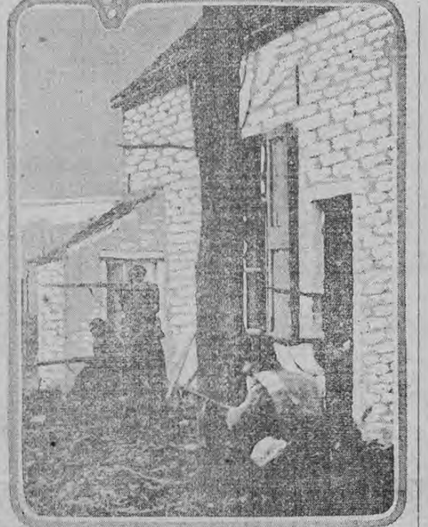
FRENCH ZOUAVES SHOOTING FROM FARM HOUSE.

Este grabado muestra a los zuavos franceses disparando contra las líneas alemanas desde la casa de una hacienda, cerca de Arrás. En muchos puntos de las 250 millas que abarca el frente de batalla, la lucha se lleva a cabo de este modo, usándose las casas como elementos de protección; de manera que cerca del frente de batalla no se encuentra una casa que no esté acribillada a balazos, o semidestruida por el fuego de la artillería.